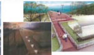
▲ デザインパース図も制作します