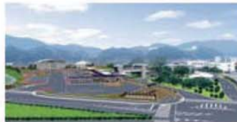
▲ 写真との合成による完成予想図