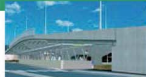
▲ CG による完成予想図