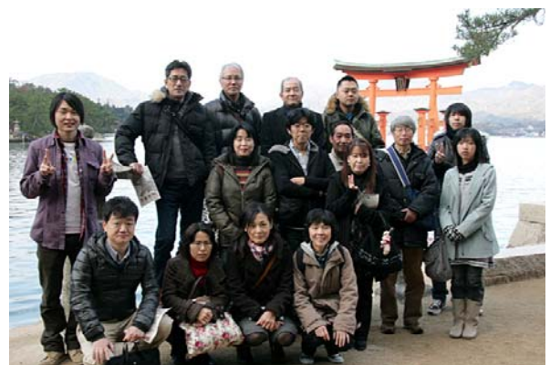
宮島にて集合写真