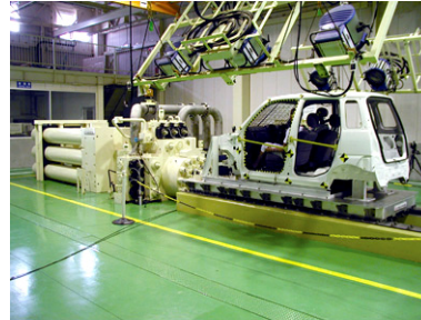
自動車衝突シミュレータ