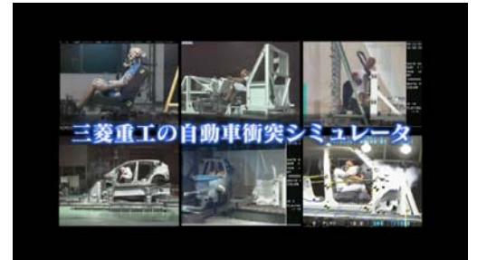
PR ビデオ メインタイトル